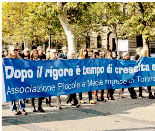
Un corteo di Pmi per chiedere il pagamento dei crediti

L O “sbloccacrediti” ideato da Unioncamere fatica a imporsi. A sei mesi dal varo, appena un milione e mezzo dei dieci stanziati sono stati utilizzati. Eppure dovrebbe essere assai utile per le Pmi che si trovano a fare i conti con uno Stato sempre più debitore incapace di rispettare i termini di pagamento. Si può infatti avere il saldo delle fatture con enti pubblici fino a 50 mila euro senza interessi. Ma lo scoglio vero è il certificato che i Comuni più grandi stentano a rilasciare.