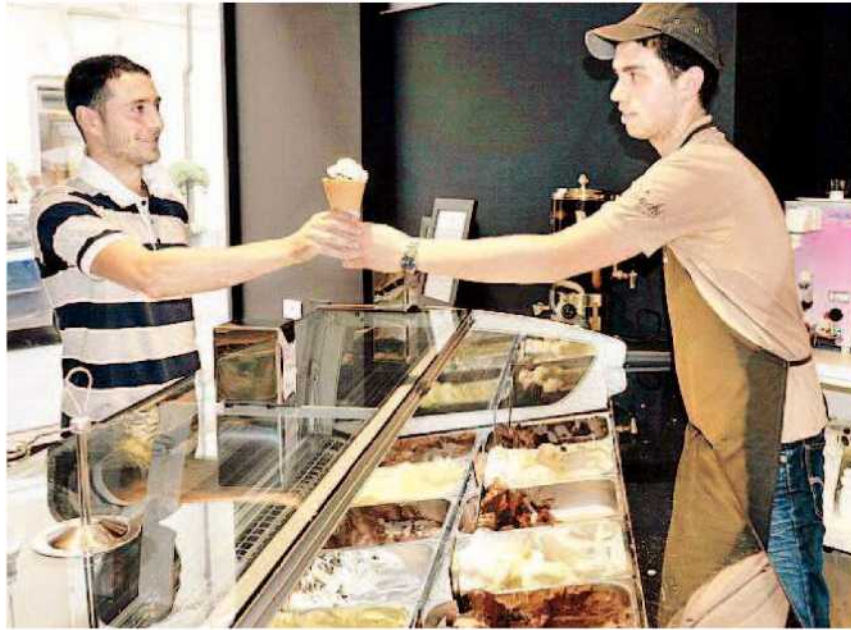
Una gelateria torinese