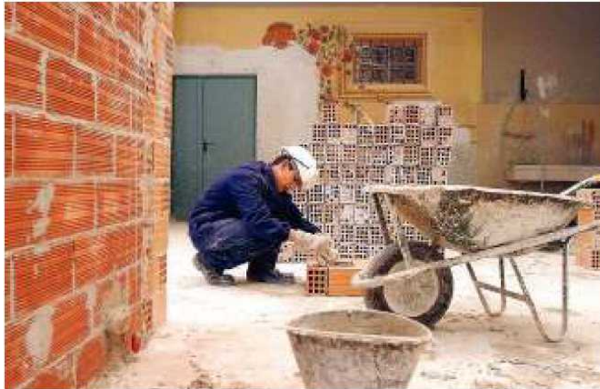
L'edilizia è tra i settori più colpiti dalla crisi