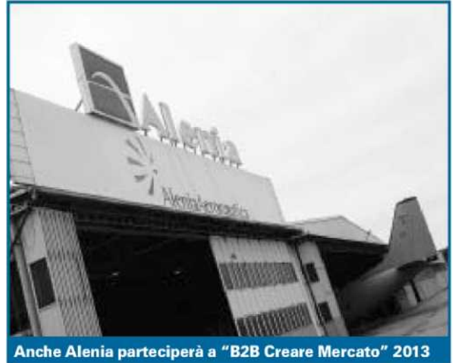
Anche Alenia parteciperà a "B2B Creare Mercato" 2013