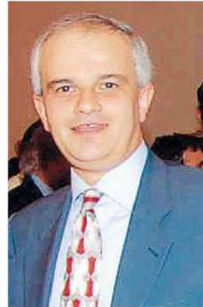
Confartigianato Biella è contraria al Sistri