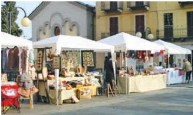
I mercatini organizzati gli scorsi anni in centro città

OMEGNA - Resta ancora qualche tassello da sistemare ma il programma del Natale ad Omegna è pressoché definito. Gli eventi inizieranno sabato 7 dicembre con l'accensione dell'albero in largo Cobianchi, anche se in realtà ci saranno due alberi di Natale perché dopo l'accensione del primo (quello vicino al municipio), un paio d'ore dopo, alle 19, ne verrà acceso un secondo vicino alla chiesa di Sant'Ambrogio, subito dopo la messa e dopo i cori di fronte alla casa parrocchiale. In realtà le feste di Natale potrebbero avere un prelude già sabato 30 novembre con la partenza del battello della Navigazione Lago d'Orta addobbato a festa, ma su questa iniziativa c'è ancora qualche incertezza. Di sicuro, invece, c'è l'impegno messo in campo dal Parco della Fantasia del Forum che proporrà, in collaborazione con il Comune di Stresa, tre week end in cui il Lago Maggiore e il lago d'Orta inter-