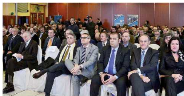
Il Congresso provinciale di Confartigianato Cuneo si è tenuto a Fossano