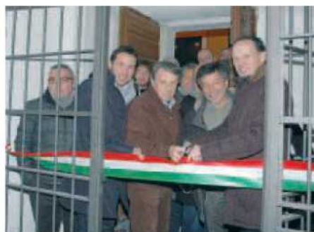
CASA DELLA CHIOCCIOLA il taglio del nastro