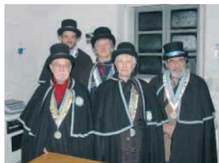
CASA DELLE CHIOCCIOLA Helicensis Fabula