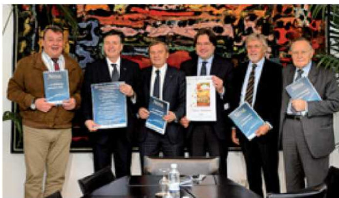
I PROMOTORI DEL "NATALE ASTIGIANO 2013"

Al cartellone di eventi ha assicurato la partecipazione anche il comitato di quartiere di San Pietro.