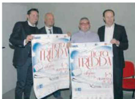
444 a FIERA FREDDA la presentazione

prodotti. Accanto alle lumache torneranno gli animali della fattoria e gli attrezzi agricoli, grazie ai quali i bambini potranno scoprire il mondo della campagna e del lavoro nei campi. In chiusura di conferenza stampa, dalla sala del Museo si sono tutti trasferiti nei locali posti al piano terreno di via Monsignor Riberi 12, una volta adibiti a carceri, divenuti poi, negli anni 70, storica sede delle attività di ricerca in campo elicico. Un ritorno alle origini dunque. Dopo anni di attriti e diatribe i vari organismi che si occupano della chiocciola, il Consorzio di Elicicoltura, il Primo Centro di Elicicoltura, l'Associazione Heli.As e l'Helicensis Fabula, hanno siglato un accordo secondo il quale coabitano e coopereranno all'interno della sede messa a disposizione dall'Assessorato all'Agricoltura. E' stata così inaugurata la Casa della Chiocciola, un nuovo centro polifunzionale dedicato allo studio scientifico, alla tutela, alla promozione ed alla valorizzazione del gasteropode.