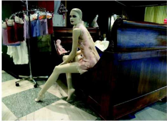
IN CORSO La mostra «I love It» è tornata in piazza Castello, a Torino

■ L'artigianato piemontese (che proprio in questi giorni è in mostra ad «I Love IT», a Torino, fino al prossimo 22 dicembre) si dichiara in totale sintonia con il mondo dell'agricoltura, impegnato in questi giorni (al valico del Brennero, ma non solo) in una importante difesa della qualità del prodotto italiano, sottolineando però come «la manifattura italiana sia l'altro lato del volto dell'Italia che produce e che va difesa con leggi e azioni concrete dalla concorrenza sleale». «Qualità intrinseca, rispetto della legislazione del lavoro e salubrità dei prodotti sono le tre discriminanti intorno a cui occorre agire per proteggere le imprese e i consumatori italiani», affermano i rappresentanti delle tre Confederazioni artigiane torinesi Cna, Casartigiani e Confartigianato, che per il terzo anno consecutivo hanno organizzato la mostra evento I Love IT in piazza Castello, a Torino, per proporre uno shopping a km zero mutuato proprio dall'esperienza del mondo agricolo, ma perfettamente adattabile ai prodotti artigiani che spesso, soprattutto nel settore alimentare, rappresentano la naturale evoluzione dei prodotti agricoli del territorio, nel segno delle tipicità enogastronomiche locali.