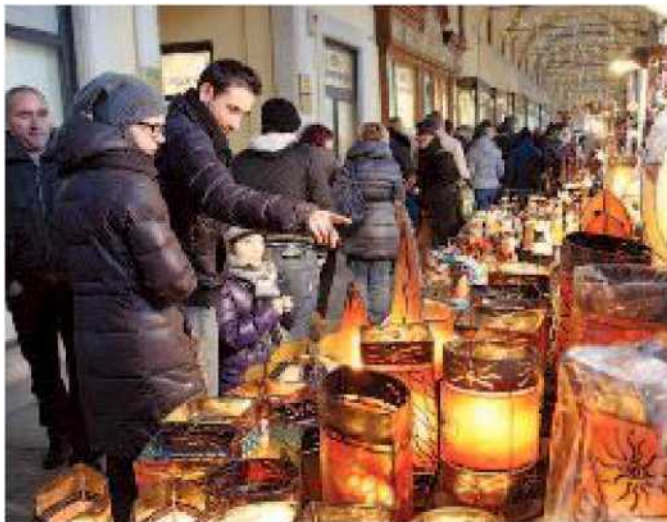
Bancarelle con regali natalizi sotto i portici di piazza Alfieri