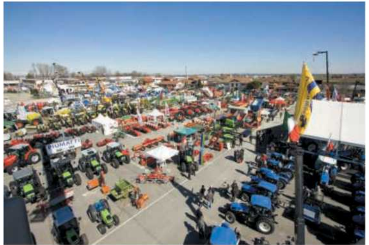
Due immagini della passata edizione della Fiera nazionale saviglianese

Invece sabato 15 marzo alle 10, sempre alla Crusà Neira, Symbola e l'Ente Manifestazioni di Savigliano presenteranno la seconda edizione del «Rapporto sulle tecnologie agricole verdi - Agreenculture», dedicato alle innovazioni tecnologiche green nella meccanizzazione agricola, che istituisce anche un encomio per le aziende distinte su questo fronte.