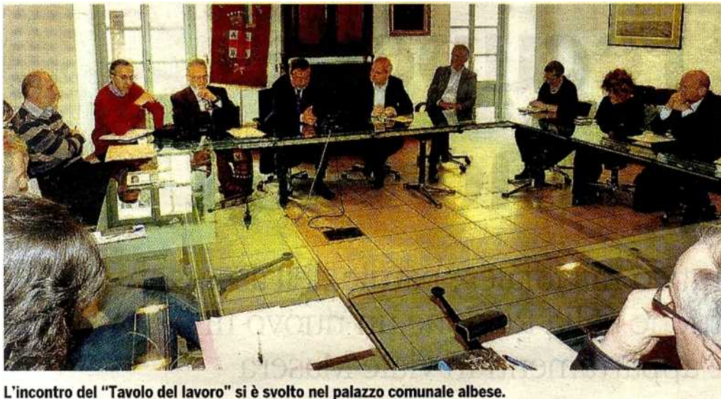
L'incontro del "Tavolo del lavoro" si è svolto nel palazzo comunale albese.