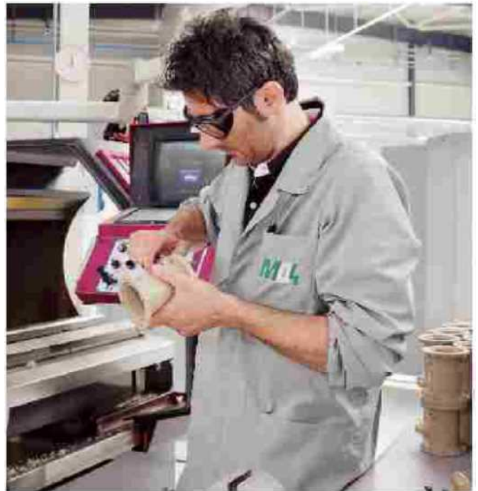
Esperti hanno assistito giovani e donne per aprire le loro aziende