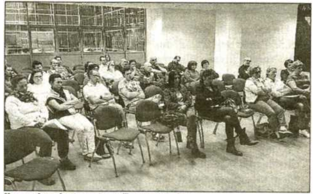
Il seminario tenuto a Borgosesia