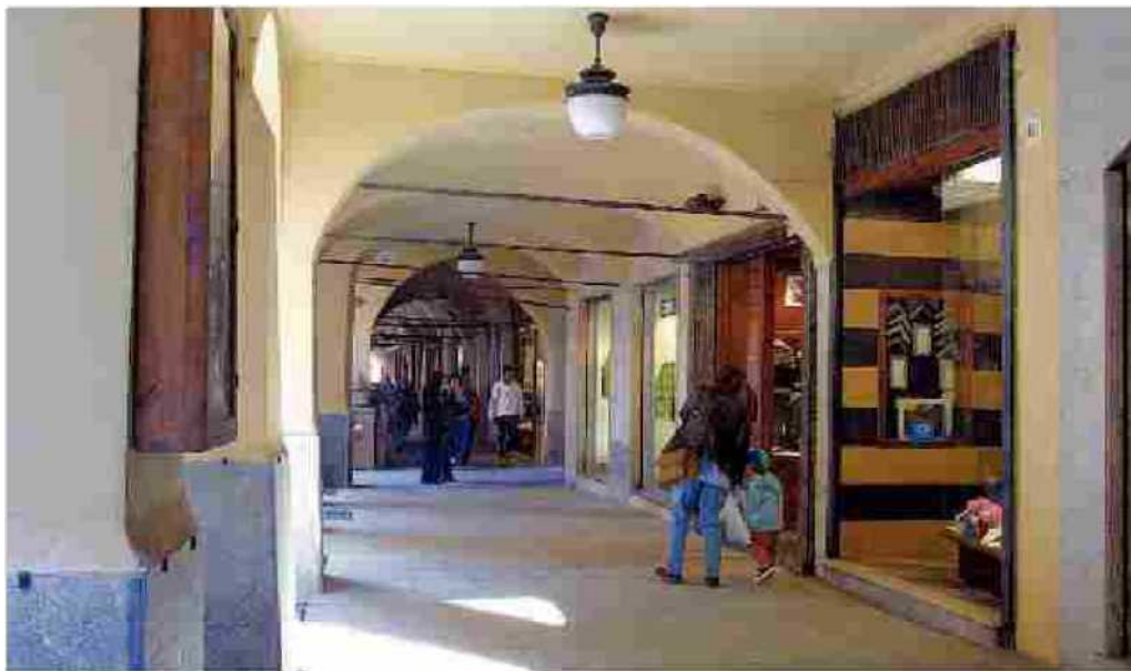
I portici lunghi di corso Roma, la principale strada commerciale di Casale

Intanto, in vista del Consiglio comunale di questa sera c'è stata una riunione di Forza Italia anche per decidere se tutti i consiglieri eletti accetteranno il ruolo, a partire dall'ex sindaco Giorgio Demezzi, che però non era presente all'incontro.