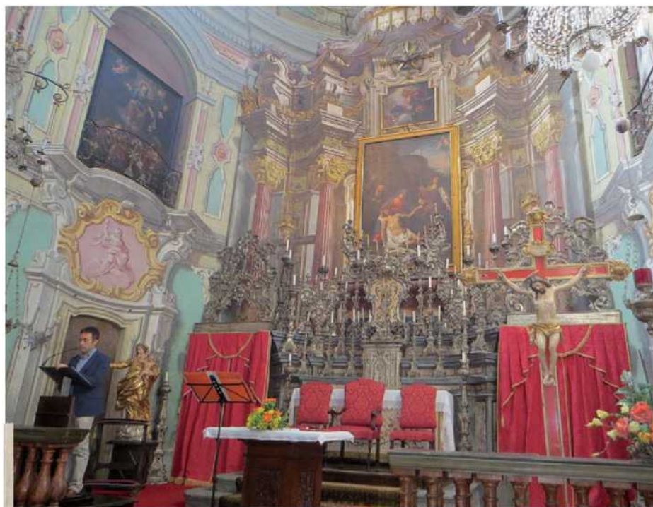
Gli splendidi affreschi dell'Arciconfraternita della Pietà sono tornati a nuova vita