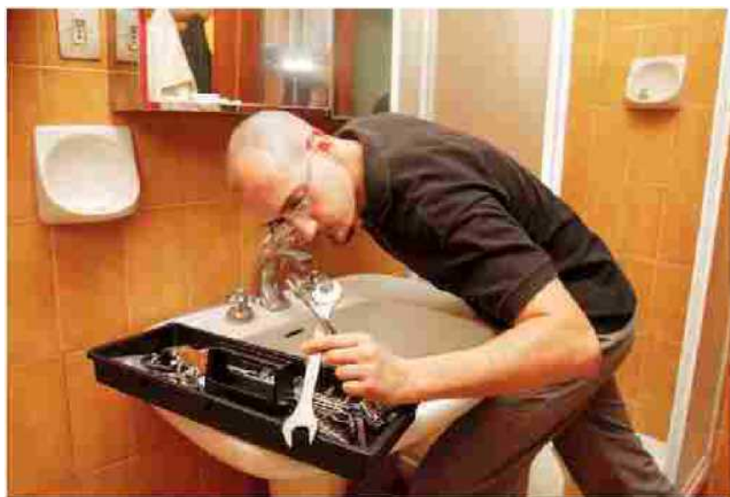
L'obbligo è scattato anche per idraulici, falegnami, elettricisti, antennisti