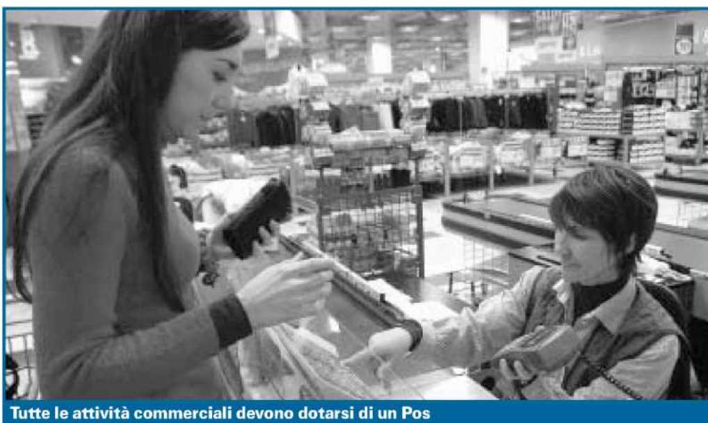
Tutte le attività commerciali devono dotarsi di un Pos