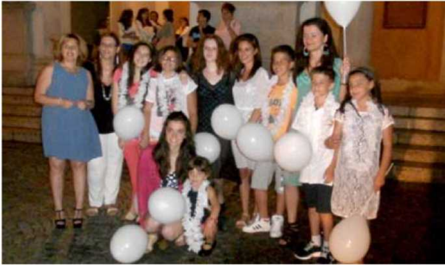
Le gente ha affollato lo stesso le strade nonostante il tempo non promettesse nulla di buono sabato sera per la notte bianca e Cossato in calice. Sopra le aspiranti miss e, a destra, uno dei banchetti dei vini pregiati con calici al cielo