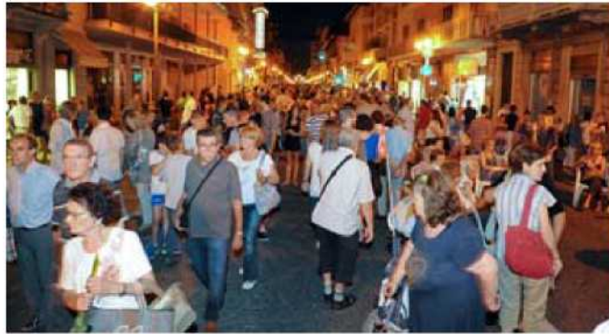
Un momento della partecipata Notte Bianca dello scorso anno