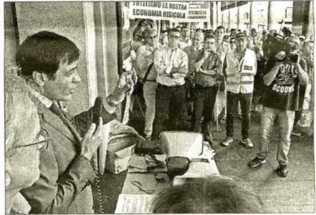
Due momenti della manifestazione che si è tenuta in piazza Martiri, di fronte alla borsa del riso, alla presenza del sindaco di Novara