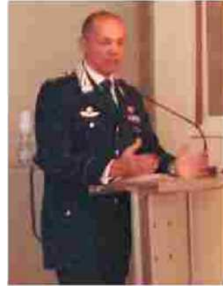
Il colonnello Della Nebbia

I rapporti di buon vicinato, specie nei centri medio piccoli, insomma la consapevolezza del rischio parlandone con chi abita accanto, sono una forma di prevenzione. [M. P.U.]