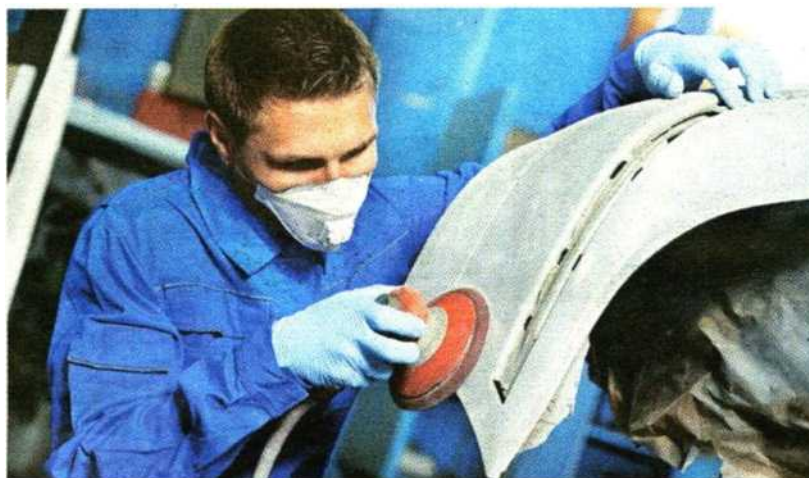
FRECCIA IN SU A Torino e in Piemonte aumentano le attività di riparazione