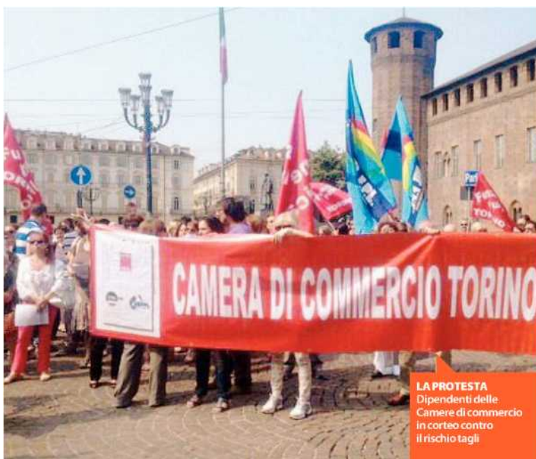
LA PROTESTA Dipendenti delle Camere di commercio in corteo contro il rischio tagli