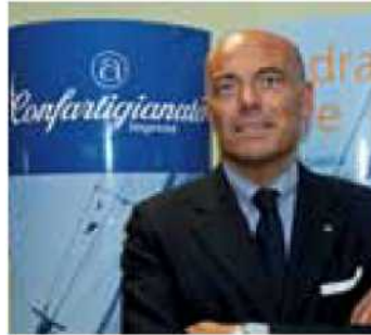
Il Presidente Adelio Ferrari

30,98 miliardi l'anno: è il costo annuo degli adempimenti amministrativi a carico delle imprese italiane. Un onere enorme, pari a 2 punti di Pil, e che, su ciascuna azienda, pesa per 7.091 euro l'anno. L'insostenibile pesantezza della burocrazia confina l'Italia al 73° posto, tra i 185 Paesi del mondo, nella classifica internazionale sulla facilità di fare impresa. Questi costi potrebbero diminuire di 8,49 miliardi, pari al 29% in meno, se venissero attuati i provvedimenti di semplificazione varati tra il 2008 e il 2012. Norme che dovrebbero alleggerire costi e vincoli burocratici in materia di lavoro e previdenza, fisco, privacy, appalti, ambiente, edilizia. Ma gli effetti di questi provvedimenti sono tutti da dimostrare. Bisogna soltanto applicare e farle rispettare, controllarne l'effetto, verificare il risultato percepito dalle imprese. Non servono nuove leggi, ce ne sono già tante, facciamo funzionare quelle che ci sono. Insomma, per abbattere il mostro della burocrazia, bisogna "semplificare la semplificazione"!