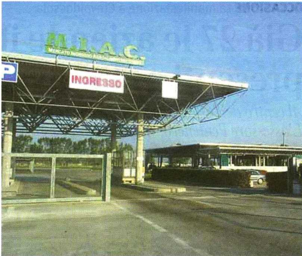
NOVITÀ PER IL FUTURO All'area tra il Miac e la Michelin