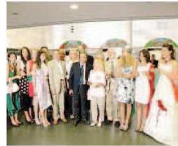
Foto di gruppo a Praga