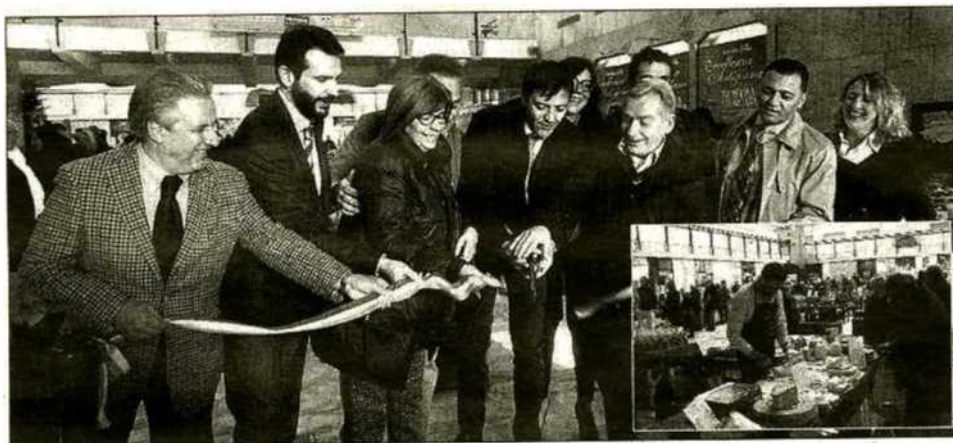
Un momento del taglio del nastro e, nella foto di Finotti, uno scorcio dell'allestimento