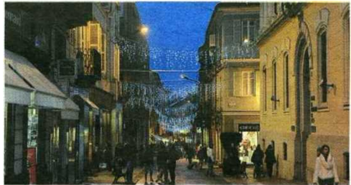
SI STANNO MONTANDO LE LUMINARIE (FOTO REPERTORIO)

Asti avrà le luminarie natalizie senza chiedere ai commercianti un contributo economico. Per il secondo anno consecutivo il Comune e le associazioni di categoria Ascom-Confcommercio e Confartigianato hanno sottoscritto una convenzione con la quale si sono divisi compiti e onere economico del servizio che vuole rendere la città più attraente (anche commercialmente parlando) durante le feste di fine anno. Le luminarie saranno allestite lungo le vie principali e su quelle di accesso ma la convenzione con le due associazioni di categoria prevede eventi collaterali e di animazione ma anche un piano di comunicazione ed informazione che possa "esportare" le diverse iniziative del Natale astigiano. Ai commercianti saranno distribuiti, gratuitamente, dei ticket parcheggio per i loro clienti e in piazza San Secondo arriverà la ruota panoramica più alta d'Italia (30 metri) vicino alle casette della cittadella di Natale con le quali dividerà gli spazi senza problemi di sicurezza. L'albero di Natale sarà invece allestito in piazza Statuto mentre, in piazza Alfieri, arriveranno i banchi del mercato gestito per conto del Comune da Procom - Confesercenti e che darà spazio a commercianti, produttori e operatori dell'ingegno selezionati per animare i Portici Anfossi e Pogliani.