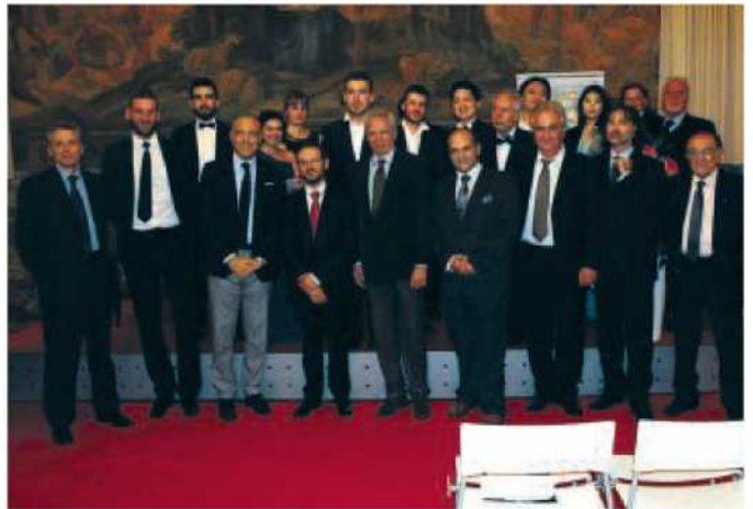
Foto di gruppo con la giuria e i dirigenti della Confartigianato