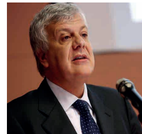
Gian Luca Galletti

il comunicato – non rinuncia, però, a pretendere i soldi dalle imprese a fronte di un servizio inesistente. Dopo che già le imprese hanno pagato a vuoto il contributo per l'utilizzo del Sistri negli anni 2010 e 2011, rilevanti risorse sottratte agli investimenti proprio negli anni in cui la crisi ha picchiato più duro. E' necessario, dunque, correggere questa misura al più presto – conclude la nota – e confermare la proroga complessiva, per operatività e pagamenti, del Sistri il tempo necessario a definire un sistema di tracciabilità dei rifiuti nuovo, efficace e condiviso con le associazioni di categoria”.