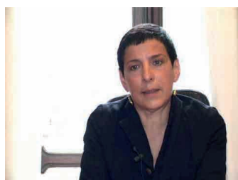
Giuseppina De Santis

L'assessore regionale alle attività produttive, Giuseppina De Santis, ha incontrato i rappresentanti del partenariato piemontese per illustrare le ultime novità della fase di negoziato legata alla nuova programmazione del Por Fesr, in vista dell'imminente approvazione da parte di Bruxelles. La Regione Piemonte ha provveduto a dicembre a trasmettere alla Commissione europea la proposta definitiva di Programma operativo regionale per il periodo 2014-2020, la cui cifra complessiva è di oltre 965 milioni di euro. «Abbiamo revisionato il Por Fesr – dichiara De Santis – rispetto alla versione di luglio sulla base delle osservazioni ricevute dalla Commissione, nonché dalle ulteriori indicazioni emerse durante la fase negoziale e di confronto