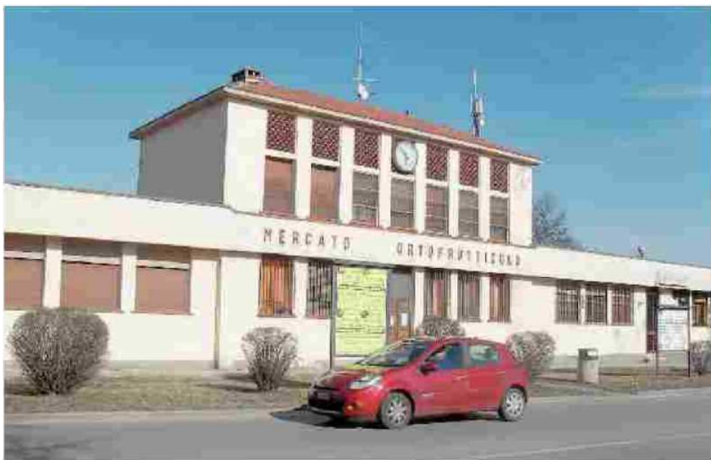
In piazza Venezia aveva sede anche il mercato ortofrutticolo: la struttura è chiusa da tempo