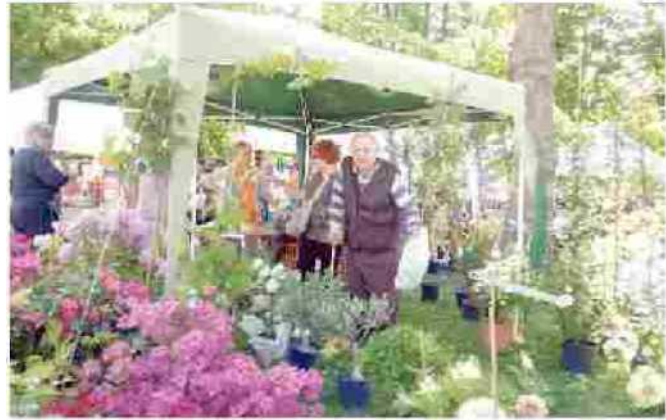
Expoflora è stata inaugurata ieri nel parco cittadino

È la manifestazione più colorata e profumata di Fossano che per tutta la giornata porterà visitatori, appassionati e curiosi nel centro storico: è «Expoflora Naturalmente con gusto», la kermesse di fiori e piante, ma anche prodotti tipici, artigianali, trattori d'epoca e auto storiche. Il taglio del nastro è stato ieri pomeriggio nel parco cittadino, tra centinaia di piante e fiori portati in esposizione da produttori provenienti anche da fuori regione, e oggi visibili dalle 9 alle 19. In largo Eroi, sempre con lo stesso orario, saranno esposti i trattori d'epoca e allestito un orto.