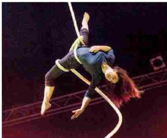
Una delle artiste del Cirko Vertigo oggi di scena a Monale

VIARIGI. Cinque autori per sei opere illustrate in altrettante location tra le più caratteristiche del paese. La mostra si intitola «Primavera letteraria» visitabile fino al 12 giugno.