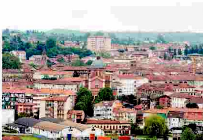
Nelle zone Sud Ovest di Asti (foto) vigilano 21 nuove telecamere

Oggi si saprà di più sulle 21 nuove telecamere entrate in funzione nella zona Sud-Ovest (Torretta, Lungo Borbore e corso Alba). A realizzare la rete di sorveglianza, la «Cosseta srl» di Tonco, vincitrice della gara d'appalto (445 mila euro più Iva, importo finanziato con fondi «Pisu»); l'impresa oltre al posizionamento degli occhi elettronici ha provveduto ad installare gli apparati di rete, il server di registrazione delle immagini e i monitor di controllo per le centrali di polizia e carabinieri. Altri 300 mila euro provenienti da extra oneri di urbanizzazione per interventi urbanistici tra corso Ales-