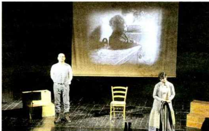
Sul palco del sociale. "Leonilda", uno degli appuntamenti di "Marzo Donna" già andati in scena. Questa settimana si parla invece di salute e violenze

Nell'ambito delle iniziative di "Marzo Donna", la Consulta delle pari opportunità, l'Asl Cn2 e Banca d'Alba hanno organizzato per venerdì 18 marzo la tavola rotonda dal titolo "Rompiamo il silenzio: endometriosi, una sofferenza nascosta" . La serata avrà inizio alle ore 21 presso la sala convegni del Palazzo Banca d'Alba in via Cavour, 4.