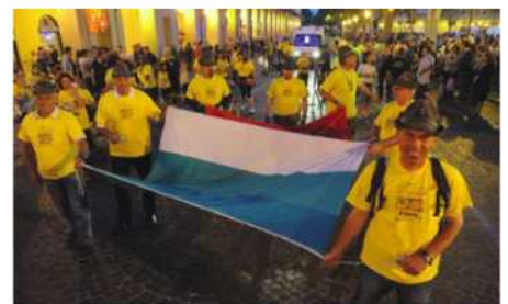
IL PERCORSO DELLA "STRAASTI" 2016 E ALCUNI MOMENTI DELLA GARA DEL 2015 Come sempre è attesa una enorme adesione da parte degli appassionati alla "corsa più armata" in città