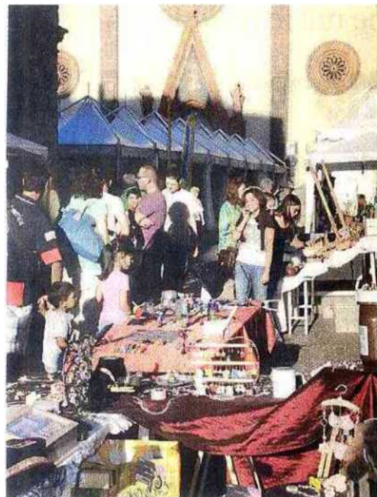
PINEROLO - Piazza del Duomo si prepara ad accogliere il cuore pulsante della Rassegna dell'artigianato pinerolese, quest'anno giunta alla 40ª edizione.

VALEGGIO SUL MINCIO - Valeggio sul Mincio, Comune veronese che dista meno di 10 chilometri dal lago di Garda e sede del secolare Parco botanico Sigurtà, è la città ospite della Rassegna. Porterà in degustazione i dolci, i vini Doc Custoza e Bardolino e gli storici agnolotti.