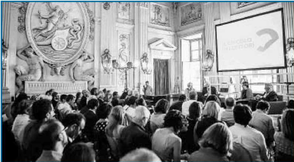
Ieri al Circolo dei Lettori è nata l'Associazione Amici Salone del Libro