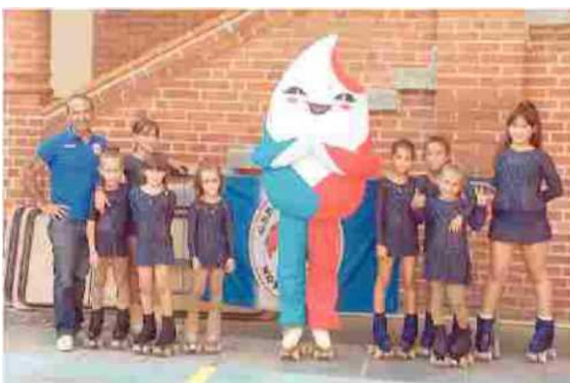
I giovani della San Giacomo pattinaggio al Roller Village