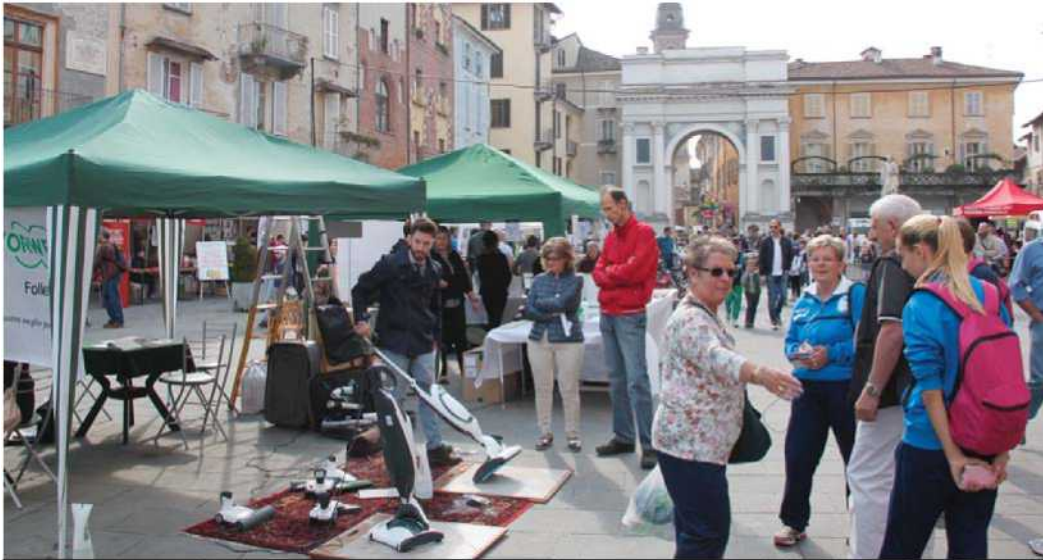
In piazza ci saranno le eccellenze artigiane, con numerose iniziative e un'area benessere