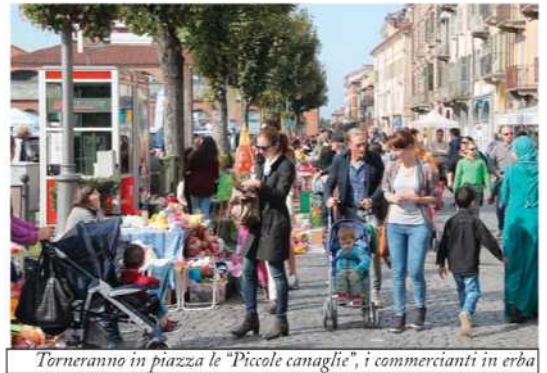
Torneranno in piazza le "Piccole canaglie", i commercianti in erba