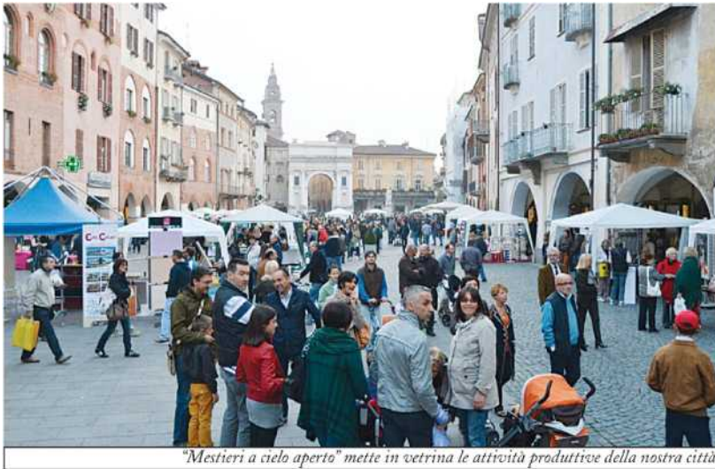
"Mestieri a cielo aperto" mette in vetrina le attività produttive della nostra città