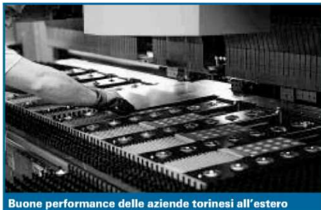
Buone performance delle aziende torinesi all'estero