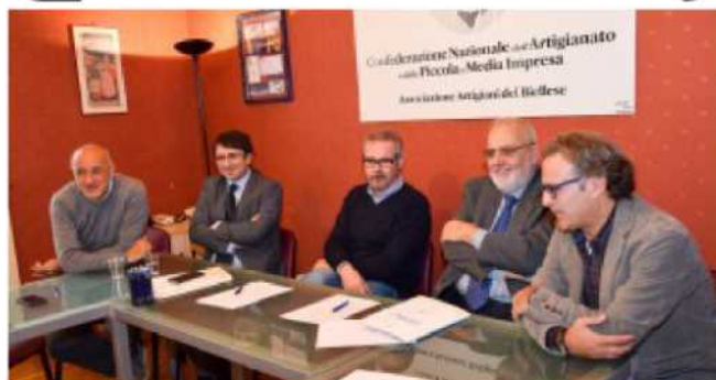
Sopra, i relatori durante la conferenza stampa di ieri nella sede di Cna Biella

PRIMO ACCORDO A LIVELLO NAZIONALE TRA CNA BIELLA E L'AGENZIA COOPERJOB PER PERMETTERE ALLE IMPRESE ARTIGIANE DI ACCEDERE AL "LAVORO SOMMINISTRATO" PERLOPIÙ USATO DALLE GRANDI AZIENDE