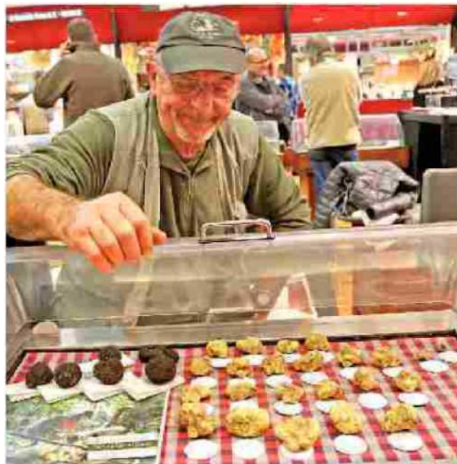
Il Palatartufo ha già registrato migliaia di ingressi