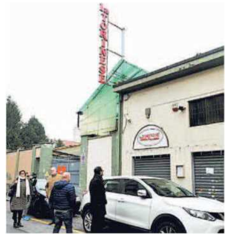
Dipendenti e clienti ieri davanti alla "Torinese"

Nei picchi stagionali le imprese con 15-20 dipendenti arruolano fino a cinque o sei persone