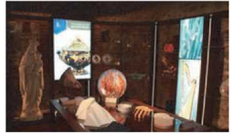
Una delle stanze del percorso museale sito nelle sale sotterranee della Confartigianato di Cuneo

presente nella sede di Confartigianato Imprese Cuneo, ha timbrato, su richiesta di moltissimi collezionisti e non, l'annullo postale della ricorrenza sulle cartoline appositamente ideate e realizzate dall'Associazione.