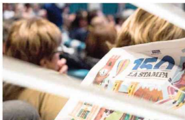
Studi e prospettive sull'economia della Granda Due immagini dell'incontro organizzato martedì al Centro incontri della Provincia a Cuneo per festeggiare i 150 anni de «La Stampa»