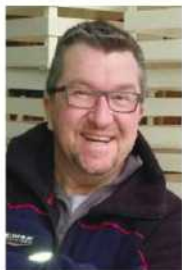
Casa del legno