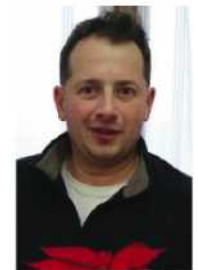
Pavideale di Mattiuz