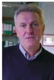
Dal Dosso srl