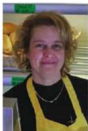
Panetteria M. Rossiglione